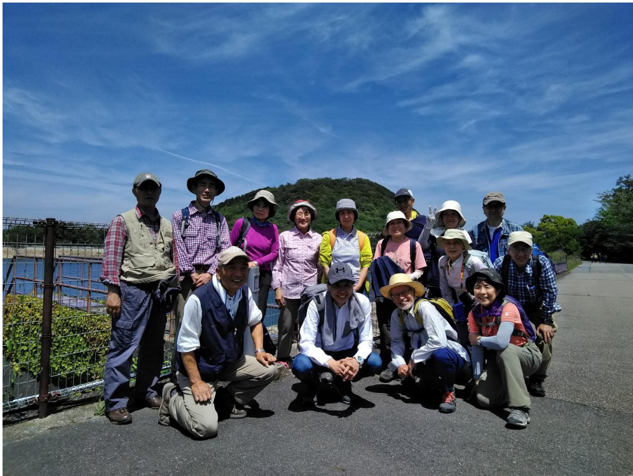
北山貯水池を経て北山植物園へ