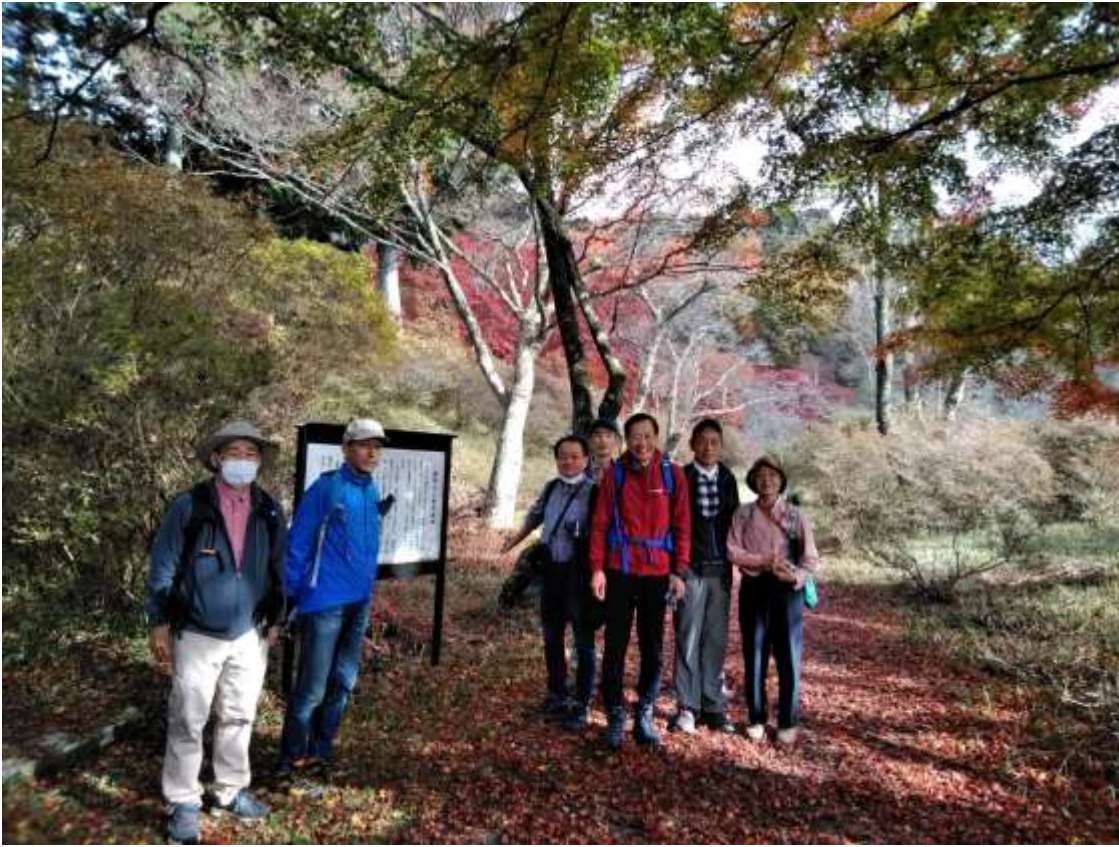
鳥見山の霊峙（れいじ）前にて

天候は曇り後晴れ、少々風が強いがハイキング日和でした。鳥見山公園の紅葉が豪華に赤く染まり綺麗でした。第一展望台、第二展望台から金剛山～山上ヶ岳の山々を眺めることが出来清々しい気持ちにさせられる。