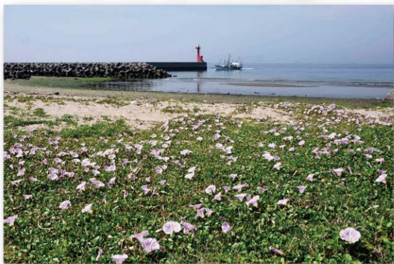
尾崎港周辺自然海岸のハマヒルガオ