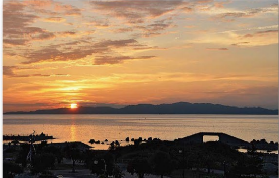
せんなん里海公園の夕陽「日本の夕陽百選」に選定