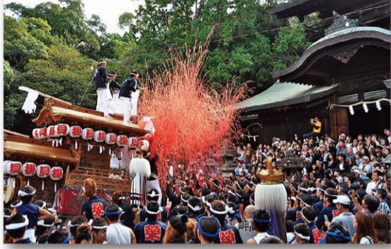
やぐら祭り(波太神社)