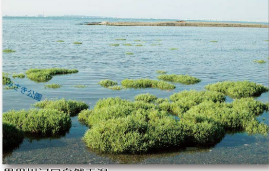
男里川河口自然干湯