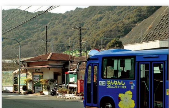
山中深駅前のコミュニティバス