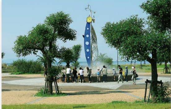
せんなん里海公園