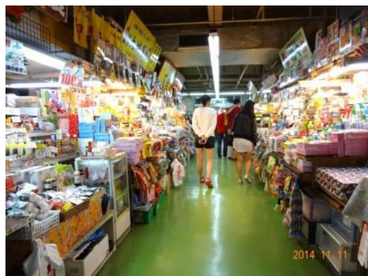
<国際通りから南へ延びる商店街の市場>