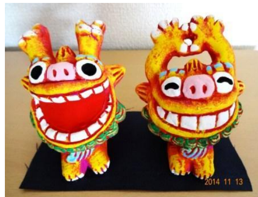
<家の守り神シーサーの人形>

さて、歩き旅の時はいつもお土産はない。今回もそのつもりで帰って来たものの、半分は観光なのでどうもまずい気がする。そこで思いついたのが、帰って直ぐの結婚記念日にサプライズのプレゼントだ。早速近所の花屋さんに行き、「これ」と指さして深紅のバラを10本ほど買ってプレゼントしたところ「私はあなたのお母さんではありません」、と。カーネーションだった。道理で安かったはずだ。