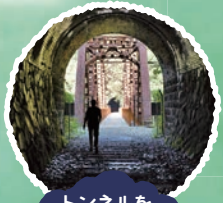
トンネルをくぐると