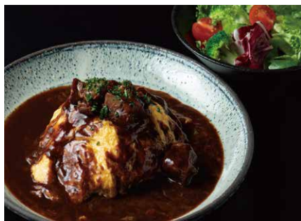
牛肉煮込みのオムライスランチ 1450