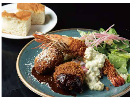
大海老ミックスフライランチ 1650

肉感のあるハンバーグに、 アウェイク特製のデミグラスソースをたっぷり。 目玉焼きをのせて。