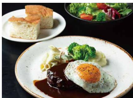
ハンバーグステーキランチ 1650

スパイスの効いた黒カレー。 じっくり煮込んだ香味野菜に、トロトロの豚肉。 お出汁のピクルスもアクセント。