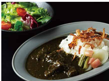
スパイシーポーク黒カレー 1350

ふわとろのオムレツに、 とろとろに煮込んだ牛肉のデミグラスソース。 アウェイク名物のオムライス。